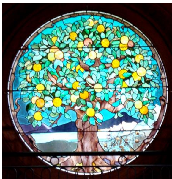
L'arbre de la science