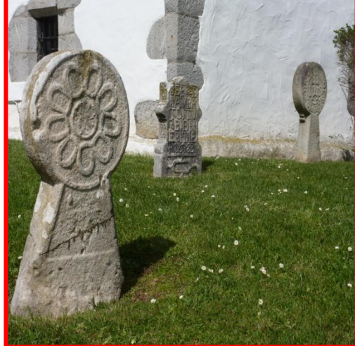
Stèles discoïdales photographie d'élève