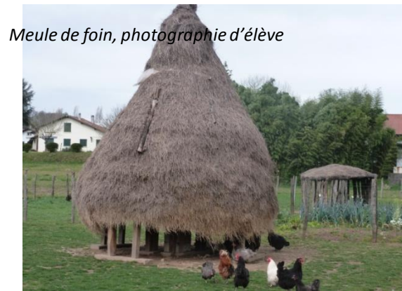
Meule de foin, photographie d'élève